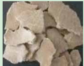
Mashudu ya karanga