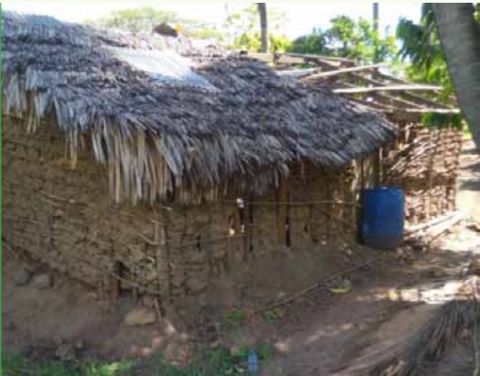
Kabla ya kujiunga na Kikundi cha Hisa