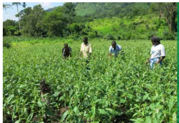
Shamba darasa la ufuta