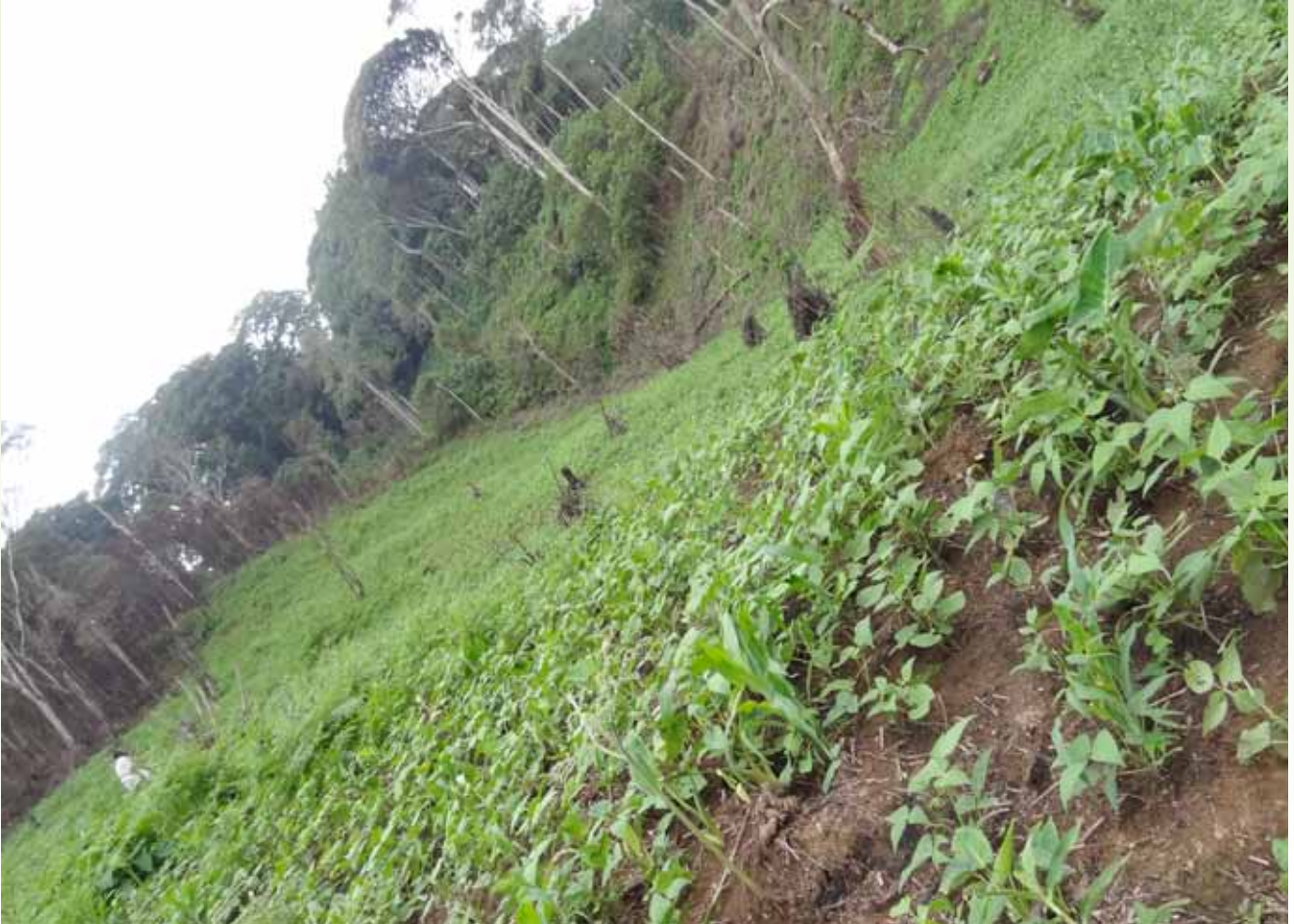
Shamba la maharage lililopo ndani ya Msitu wa Hifadhi ya Mazingira Asilia ya Mkingu

2014 hadi Septemba 2015 Msitu wa mazingira asilia ya Mkingu umeweza kupoteza hekta 90 ambayo ni sawa na 0.6% ya uharibifu wa msitu kwa mwaka.