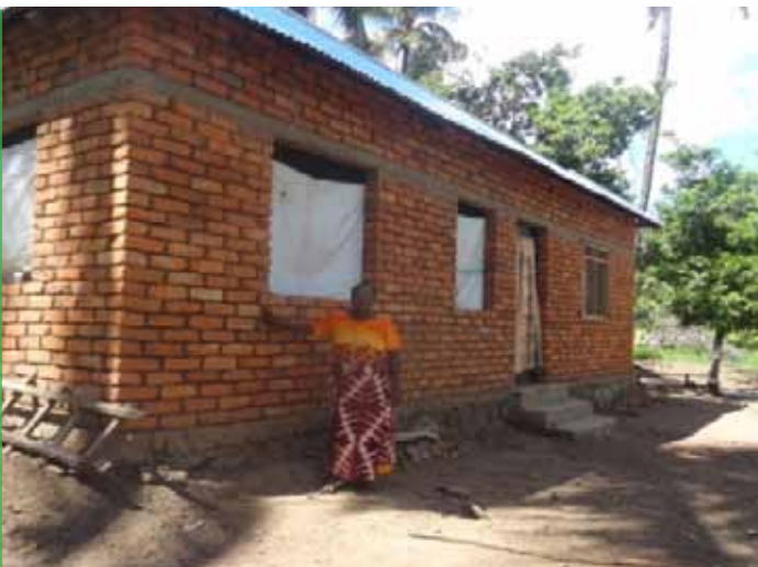
Baada ya kujiunga na Kikundi cha Hisa