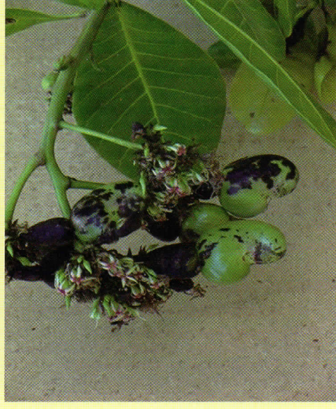
Mabibo machanga hugeuka meusi