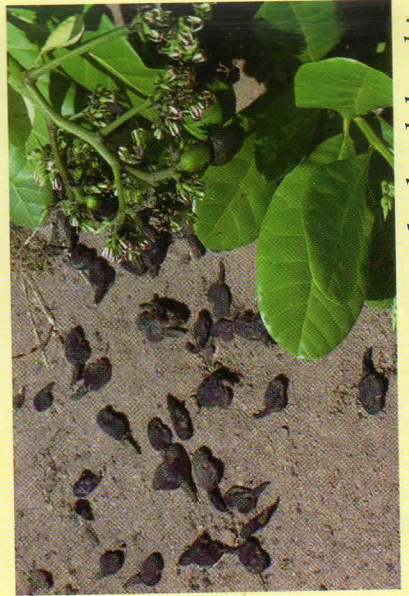
Korosho changa huweza kudondoka chini