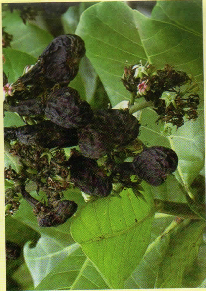
Korosho changa huwa nyeusi mithili ya rami na hukauka kabisa