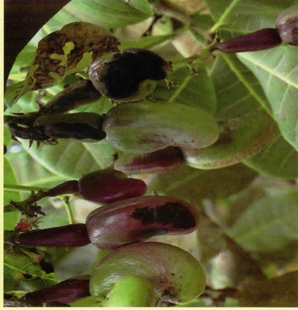
Korosho changa huanza kuwa na mabaka meusi