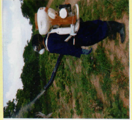
Pulizia viuatilifu kudhibiti Blaiti

Tumia viuatilifu vyenye viambata sumu aina ya ‘ Trifloxistrobin ’ au ‘ Picoxystrobin ’.