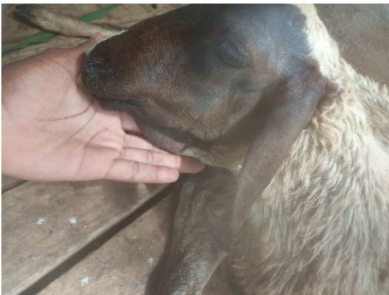
E. Kondoo mwenye uvimbe taya la chini