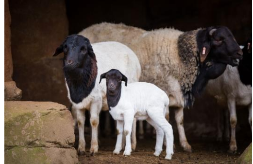
B. Kondoo wa Somali