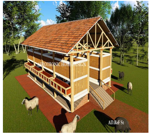
H. Bandaa la juu la kondoo