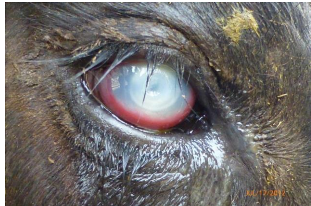
F. Kondoo mwenye macho meupe