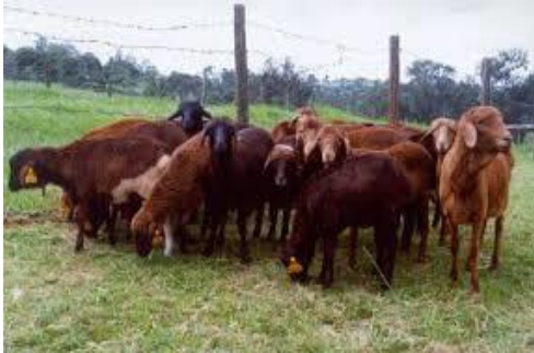
A. Kondoo wa Masai