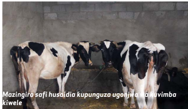
Mazingira safi husaidia kupunguza ugonjwa wa kuvimba kiwele

Kuvimba Ugonjwa wa kiwele kwa ujumla kuna dalili zenye kutambulika kirahisi; maziwa huonekana kuwa na michirizinyuzi/chembechembe na huonyesha