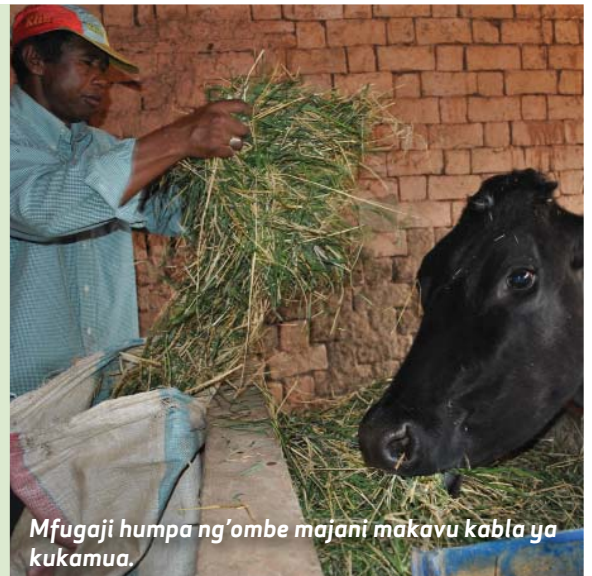
Mfugaji humpa ng'ombe majani makavu kabla ya kukamua.