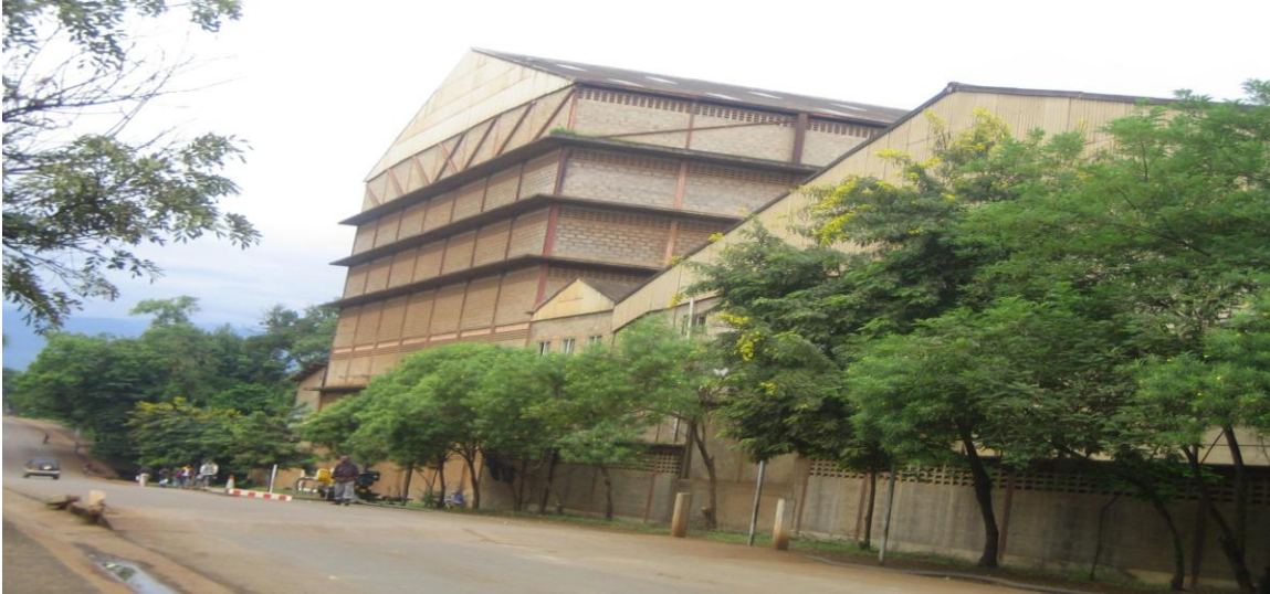
Ghala la TCCCO Kilimanjaro ni miongoni mwa maghala makubwa yanayotumika kutunza zaidi ya zao moja chini ya Mfumo huu.

2008/09. Jumla ya maghala matatu mapya yameomba kusajiliwa kwa ajili ya kutumia Mfumo wa Stakabadhi za Maghala. Maghala hayo ni City Coffee –Mbeya, DAE Ltd-Mbinga na Mbinga Coffee Curing Co.Ltd –Makambako