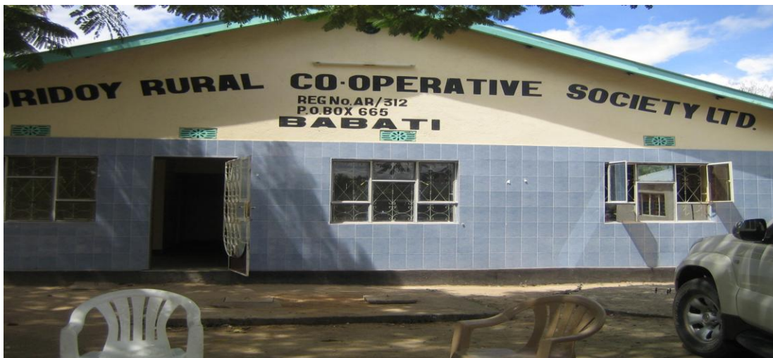
Jengo la Chama cha Msingi Oridoy-Babati lililojengwa kutokana na mafanikio ya Mfumo wa Stakabadhi za Maghala

Chama cha Ushirika cha Msingi cha Oridoy kilichoko wilaya ya Babati, mkoa wa Manyara wanafaidika na mfumo huu. Ghala na jineri ya KNCU-Moshi limetumika kuhifadhi na kuchambua pamba mbegu. Aidha vyama vya Ushirika vya Msingi mkoani Shinyanga vimeanza kutumia Mfumo huu kuanzia msimu wa 2007/08 kwa kuhifadhi na kuchambua pamba katika jineri ya Uzogore chini ya mwendesha ghala –SIBUKA FM LTD.