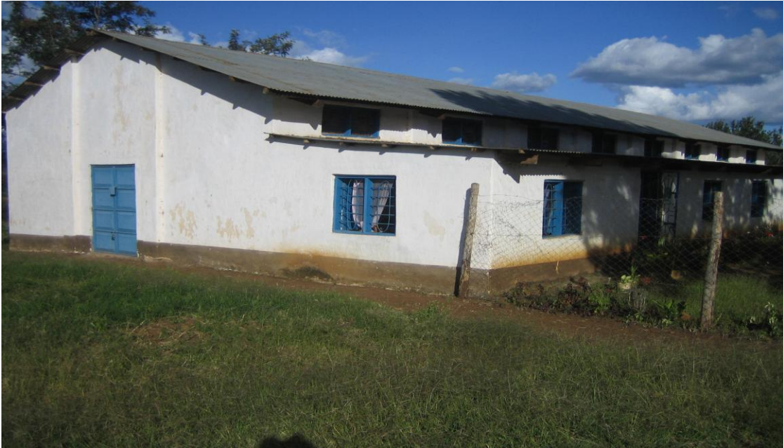
Ghala la kijiji cha Masakta –Wilaya ya Hanang lililoboreshwa kwa uendeshaji wa Mfumo wa stakabadhi za mazao ghalani