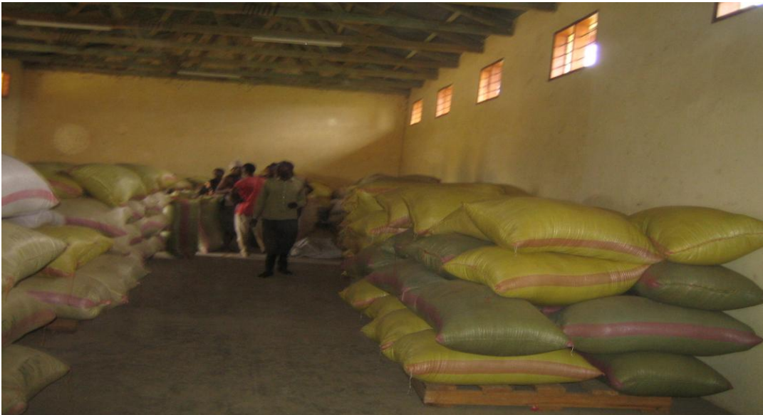
Uhifadhi wa mazao ghalani unaoendeshwa na SACCOs ya Mshikamano Magugu-Babati

Uendeshaji wa mfumo huu pia umeigwa na kuendeshwa na program mbalimbali ikiwemo ya MRSP kupitia mpango wa benki mazao yakiwemo maeneo ya Magugu-Babati, Masakta-Hanang, Mbarali n.k. Juhudi hizi zinahitaji kuimarishwa ili kukidhi vigezo vya uendeshaji wa mfumo kwa mujibu wa mwongozo wa uendeshaji uliotolewa na Bodi ya Leseni za Maghala Tanzania.