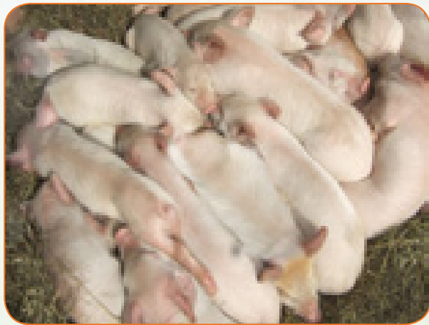
Kuimarishwa kiwango cha kutokufa