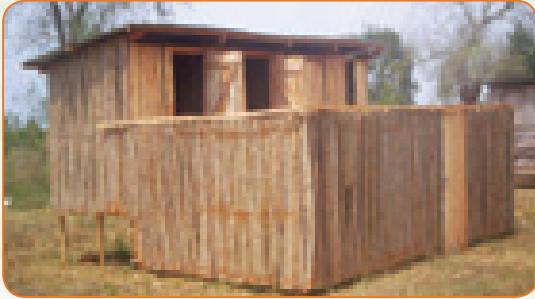
Nyumba ya mbuzi

Nyumba ya kawaida tu inayotengenezwa kutokana na asilia zinazopatikana katika mazingira yako inapendekezwa ili kuokoa gharama.