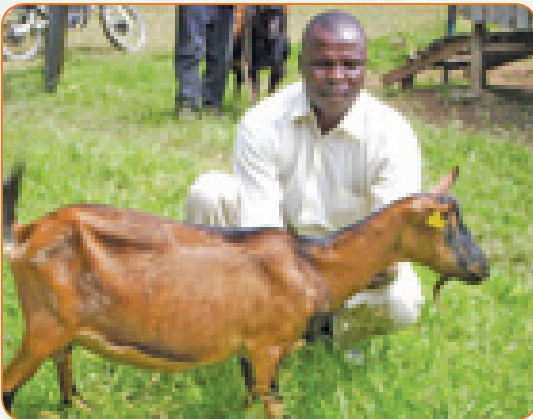
Mbuzi wa kike wa Alpine